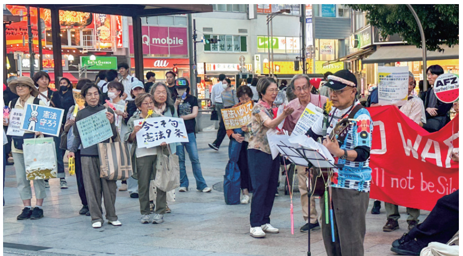
「戦争反対、憲法9条守れ」の声をあげる参加者 =5月19日、赤羽駅東口

この日は戦争法強行採決の日になんだ「19日行動」で国会前の1万人をはじめ、全国で集会やデモが繰り広げられ、私も赤羽でマイクを握りました。(のの山けん)