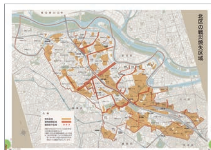
第2章 迫りくる戦火