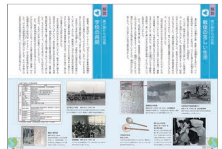
第3章 焼け跡からの出発