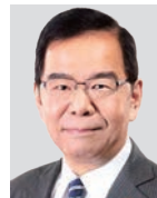
志位 和夫 (南関東)