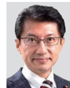
田村 貴昭 (九州・沖縄)