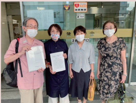
要請を終えた会のメンバー = 10日、北区役所