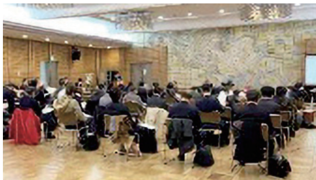
昨年度総会の様子

総会は、まちづくりに関心のある方なら誰でも参加できます。赤羽小学校、赤羽公園など周辺公共施設の意見交換を行う場ですので、ぜひ総会に参加し、積極的にご発言頂くことを呼びかけます。(のの山けん)