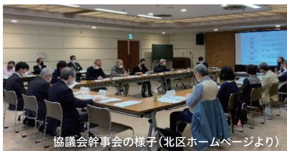
協議会幹事会の様子

赤羽駅東口地区まちづくり全体協議会は、この夏に開く総会で住民側の「まちづくり提案」を採択する予定。地域住民の声を「提案」に反映させるためには、総会前に誰もが参加できる、まちづくり懇談会の開催が必要です。