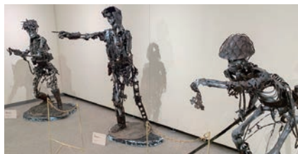
陸軍兵士の問いかけ他3体