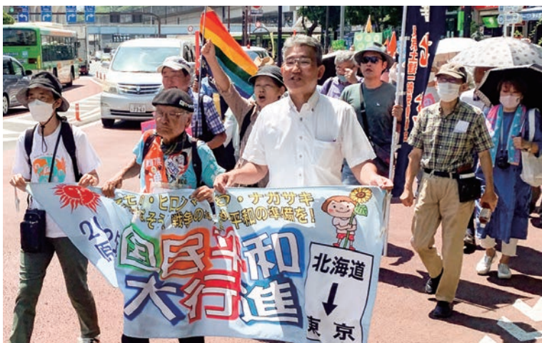
王子駅周辺をパレードする国民平和大行進の参加者 =7月26日

8月7日から9日まで 原水爆禁止世界大会・長 崎が開かれます。現在、 広島・長崎に向けて5月 7日に北海道・礼文島を 出発した国民平和大行進 が、日本列島を縦断して います。 26日には行進が北区入 り。王子駅前公園には、 炎天下の中、区内団体の