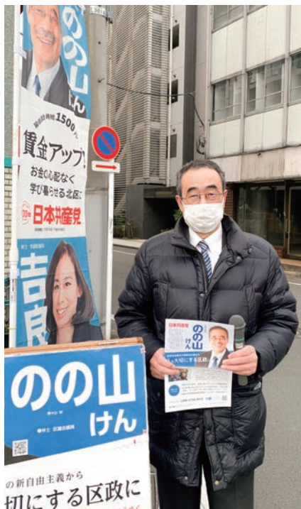
赤羽岩淵駅で区政報告 =1月27日