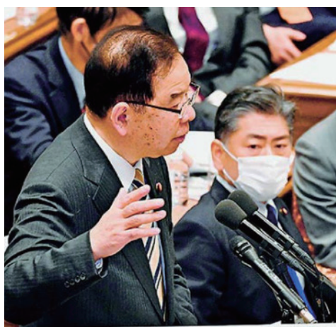
国会で質問する志位委員長 =1月31日