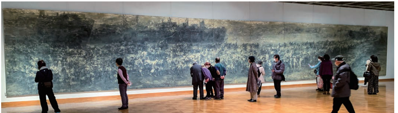
北とびあ地下展示ホール的一面を覆いつくすスケールで描かれた作品「一九四六」

11日から15日まで北とびあ地下展示場で開かれた、中国の画家・王希奇氏による作品「一九四六」の展示会を鑑賞。縦3m横20mのスケールで中国からの引き揚げの様子を描いた大作は、観る者を圧倒。目の前に引揚船が停まっているかのような錯覚に陥りました。(の山けん)