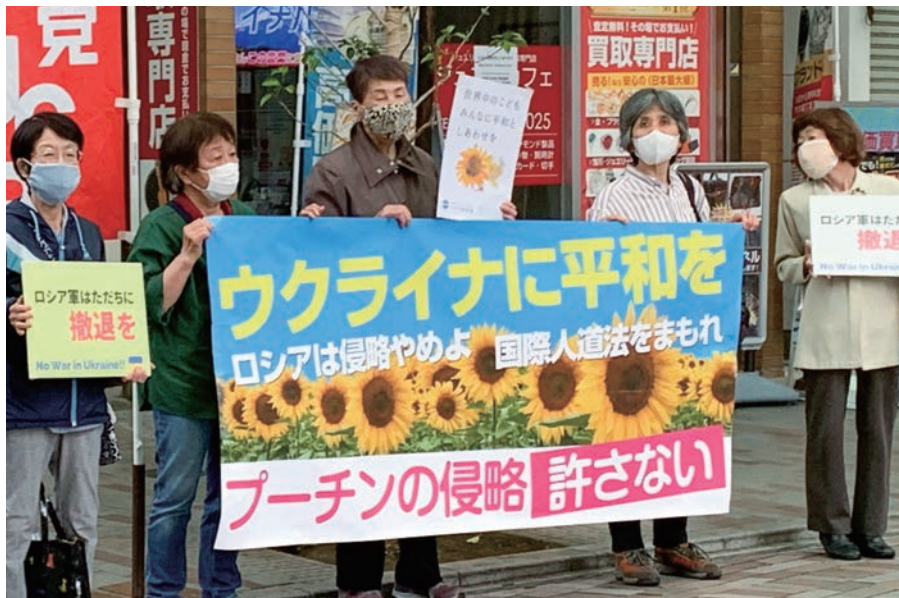
日本共産党女性後援会による街頭宣伝 =4月24日