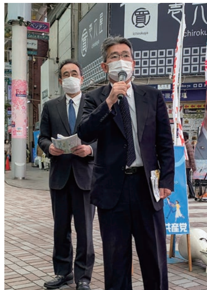
日本共産党区議団の宣伝 =4月17日