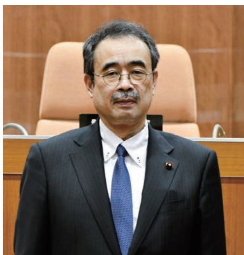
代表質問に立つ、のの山けん区議