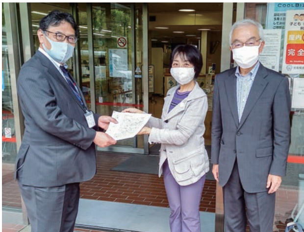
前田保健所長(左)に要請書を手渡す北区議員団

新型コロナウイルス接種の予約が取りにくいなどの声を受け、日本共産党北区議員団は10日、北区にアクセスの改善を要請しました。(のの山けん)