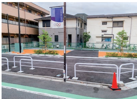
「計画道路を体感できる」というが…

都と北区がなすべきは、しゃにむに計画を押し進めることではなく、住民の声に耳を傾けて、計画を抜本的に見直すことです。(のの山けん)