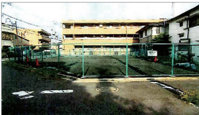
東京都が管理する事業用地