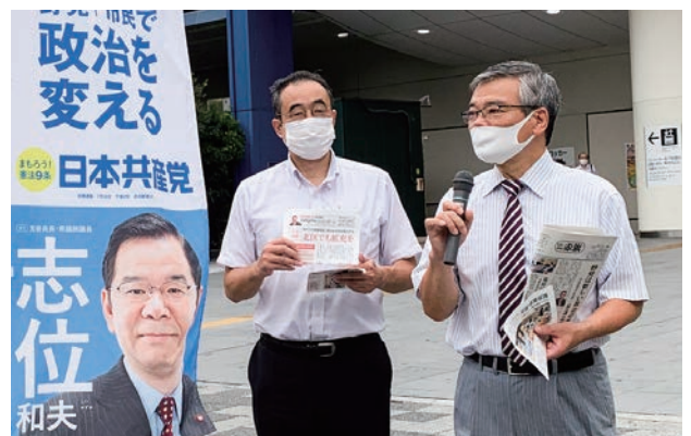
そねはじめ都議(右)と赤羽駅東口で訴え

1日、赤羽駅東口で、そねはじめ都議とともに早朝宣伝。「首相退陣を機に、アベ政治からの抜本的転換を」と訴えました。(のの山けん)