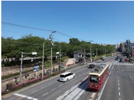
明治通りから見た飛鳥山公園

3日に開かれた企画総務委員会では、今議会に提案されている北区長等の給料等に関する改正条例案の審査がおこなわれました。この条例は、区長、副区長、教育長の給与について、月額を減額する一方で期末手当を引き上げ、総額としては給与を増額するものです。私は、「昨年の消費税10%増税で区民の暮らしと営業に大きな負担がのしかかっている時に、給与引き上げでよいのか。区長、副区長、教育長は4年勤めるごとに退職金