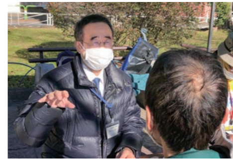
年越したすけあいフェスで生活相談 22年12月25日赤羽公園

ゆきすぎた職員削減は、学校や保健所で深刻な人手不足を招いています。民間だのみの「外部化」で、働く人の賃金が押し下げられてきました。私は、北区がこの20年間突き進んできた経済効率最優先の「行革」路線から、人を大切にする区政へと転換させるために、全力をつくします。