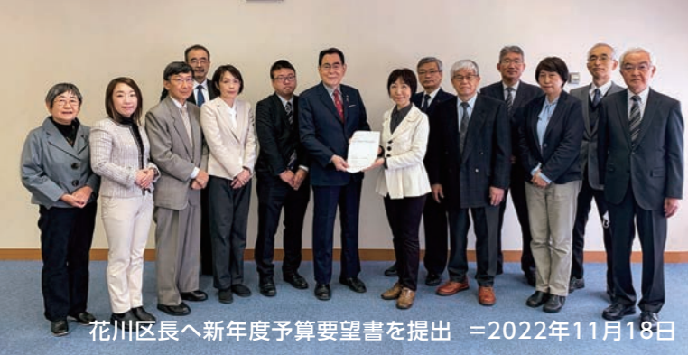
花川区長へ新年度予算要望書を提出 =2022年11月18日