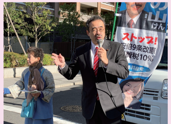
毎週欠かさず街頭からの区政報告を続けています