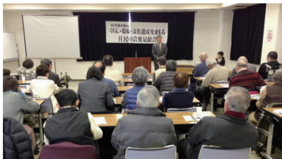
赤羽西86号線に反対する住民の会発足総会

区内3路線4カ所で計画されている特定整備路線。防災に役立たないばかりか、多くの住民を立ち退かせ、コミュニティや文化遺産、自然環境を壊すとして、地元住民から大きな反対運動が起きています。