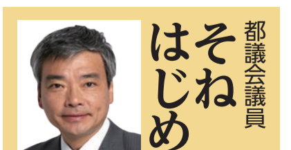
都議会議員 はそねめ 北区議員団とともに頑張ります