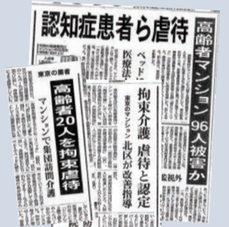
虐待問題を報じる各紙記事

まだまだ足りない特養ホーム。日本共産党は、引き続き施設整備に全力でとりくみます。