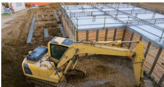
不要不急の事業は見直しに

区はこの3月に111の計画事業を盛り込んだ「北区基本計画2020」を策定しました。しかし、新型コロナによって財政に影響が出ることから、6月には副区長から、不要不急の事業については休止、先送りとするなど見直しを図るよう指示する依命通達が発出されました。一方、区が積み上げている貯金（財政調整基金）の残高は約180億円あります。暮らし、営業を支えるために緊急活用することも必要です。